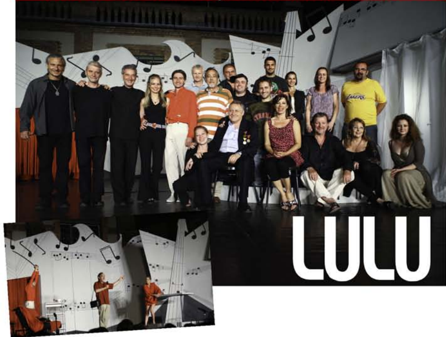
KASZSA – Siker! – Körmenyi Augusztusi Szabadtéri Színházi Alkalmom –

Siker darab a Batthyány kastély udvarán.