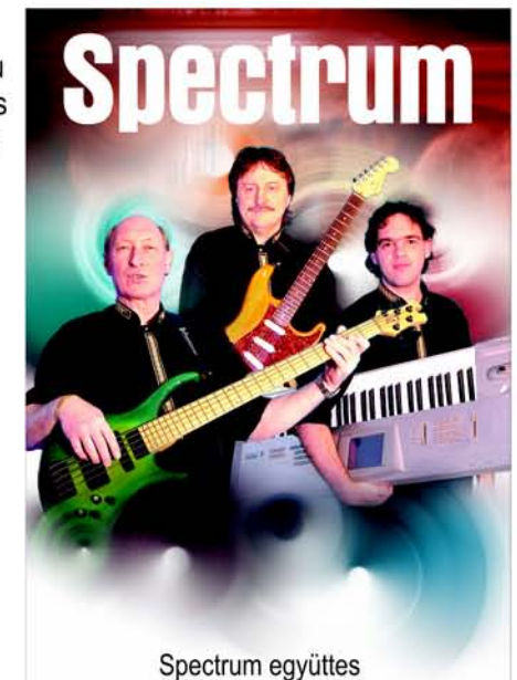
Spectrum együttes Jazz, country, rock&roll, külföldi és hazai slágerek