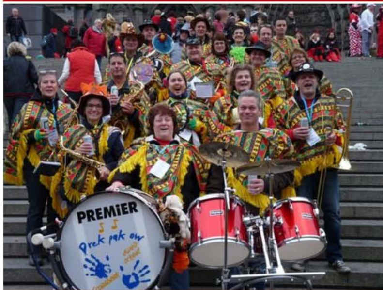
A hollandiai Groesbeek Drek Pak OW nevű zenekara utcai hangulátzenét játszik Szabadság tér, augusztus 17. 16.30, augusztus 18. 18.40, augusztus 19. 18.15