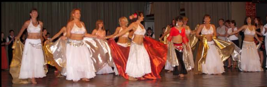
Batthyány kastély kertje, augusztus 19. 22.00 óra