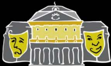
KÖRÖNDI KASTÉLY SZÍNHÁZ TÁRSULAT

A nagy hagyományú köröndi színház jelenkori képviselője városunkban a KASZT, 1995 óta. A társulat először Köröndi Amatőr Színház Társaság, majd Köröndi Alternatív Színház Társaság, 2004-től pedig Köröndi Kastély Színház Társulat néven működik. A Társulatban diákok és nyugdíjasok, értelmiségiek és fizikai munkát végzők egyaránt megtalálhatók, ennek ismeretében talán még inkább büszkék lehetnek arra, hogy amatőr társulatként, profi teljesítményt nyújtva a szakma is többször elismerte őket. A társulat különös gondot fordít az utánpótlás kinevelésére, éppen ezért a KASZT Stúdió előadásában éppúgy feltűnnek a felnőtt szereplők, ahogy a Stúdiós gyerekek is rendszeres szereplői a felnőtt előadásoknak.