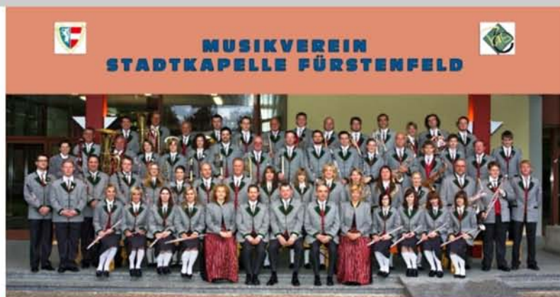
MUSIKVEREIN STADTKAPELLE FÜRSTENFELD